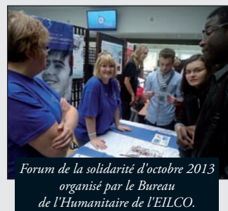
Forum de la solidarité d'octobre 2013 organisé par le Bureau de l'Humanitaire de l'EILCO.

associations de lutte contre racisme lors du forum de la solidarité organisé par nos élèves. Nous prévoyons des actions de découverte des cultures avec les associations étudiantes.