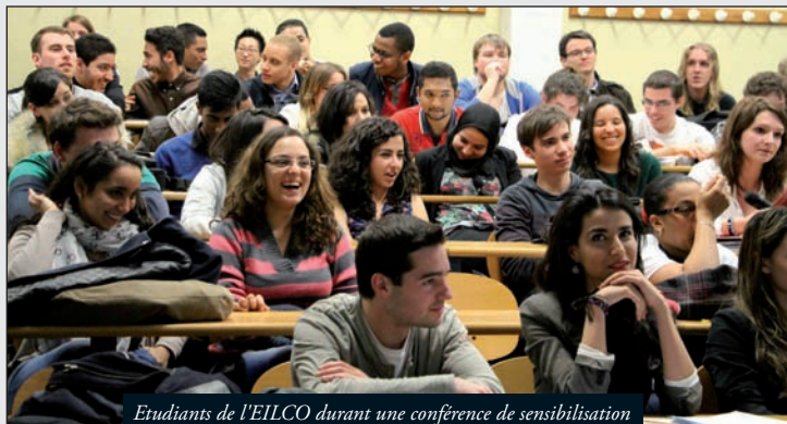
Etudiants de l'EILCO durant une conférence de sensibilisation et d'ouverture aux trois religions monothéistes.